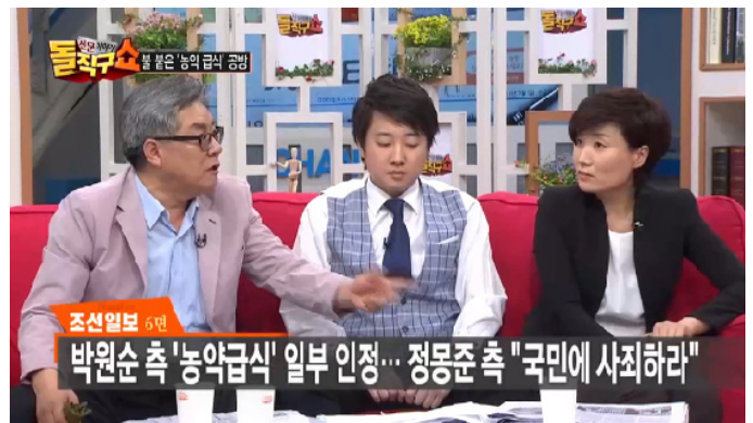
△5월 29일 채널A <돌직구쇼> 화면 갈무리