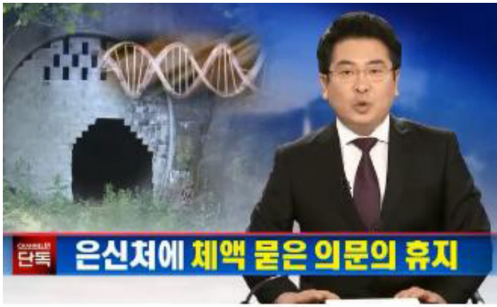
△ 5월 28일