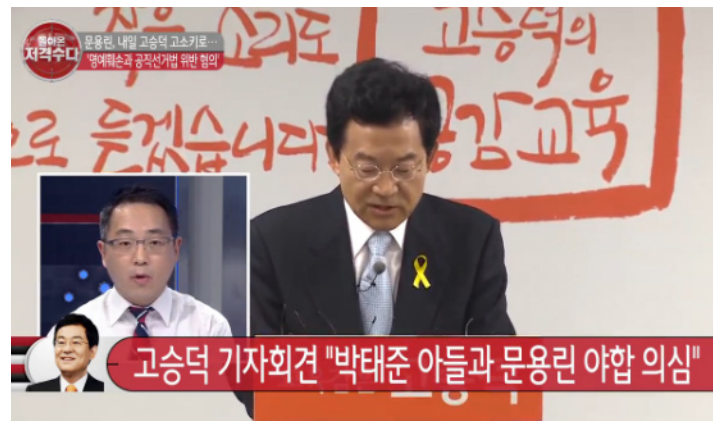
△ 6월 1일 TV조선 <돌아온 저격수> 화면 갈무리

한편, 이날 채널A <이동관의 노크>에서는 서울시시장 선거 관련 정몽준 후보가 들고 나온 이른바 ‘농약급식’ 프레임을 언급했다. 사회자와 출연자 황태순 씨는 “이 문제의 핵심은 ‘농약’이 아니라